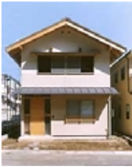
ワークショップ「き」組の スタンダードモデル