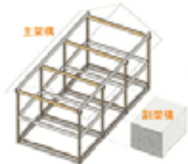
リニアタイプ(横長型) 基本プラン