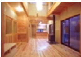
木と自然材料を生かした家 (ひとときネット)