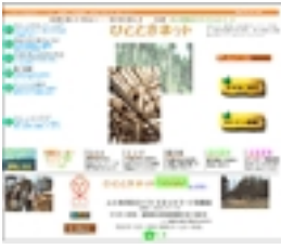
『ひとときネット』のWEBサイト。