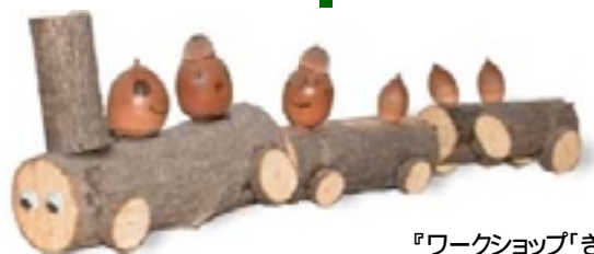
ひとときクラブでつくった木のおもちゃ

「この方法でならいっしょに仕事していける」そんな信頼関係で結ばれたつくり手同士のつながりがネットワークですが、実はつくり手だけでは、家づくりはできません。あたりまえですが、実際に家づくりをする「施主」がいることで始めて、ネットワークでの家づくりが動き出します。つくり手同士が対等な信頼関係で結ばれているのと同じように、住まい手も信頼関係を原理としてこのネットワークに加わる。それが、このネットワークが成立する何よりの前提です。