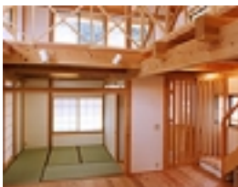
適正価格モデルとなった家 (ワークショップ「き」組)

木の家ネットの会員になっているつくり手は、だれもが仲間とこうした協働関係を築いて仕事をしてきています。この、普段から協力しあって木の家づくりをしている「いつものチーム」にあえて「ネットワーク」としての名前を付け、「このネットワークで、普通に手の届く価格で木の家づくりができますよ」と名乗りをあげています。伝統構法は手仕事ですから、簡単に施工できてしまう住宅とくらべると、どうしても大工さんの手間がかかります。もともと技術をもった人同士がネットワークを組んでいるのですから、お金をいくらでもかけてよいのなら、むずかしいことではないのですが、それを限られた予算の中で、大工さんの手間以外にも、素材や設備にかかる費用をみながら実現するには、いろいろな工夫が必要です。今までと木の家づくりをしながら培ってきた経験から、それを方法論として定着させ「この位の予算でできますよ」とシステム化しているのが、ネットワークの最大の特徴です。