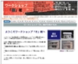
『ワークショップ「き」組』のWEBサイト。

パンフレットやWebサイトで一番はじめに目にするあいさつ文。そこにはそれぞれのネットワークの思いが、明るく、力強く表明されています。